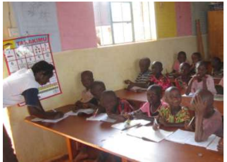
【宿題を見てもらう低学年】