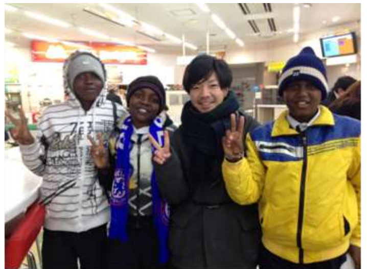
【約18時間の空の旅。空港に降り立ち、ほっとした】

(地域や諸事情により、放送日時が変わることがあります)番組の収録後は、ACEF支援者のサポートで、埼玉にて1人ずつホームステイをしました。様々なことを学び、貴重な体験をしたようです。