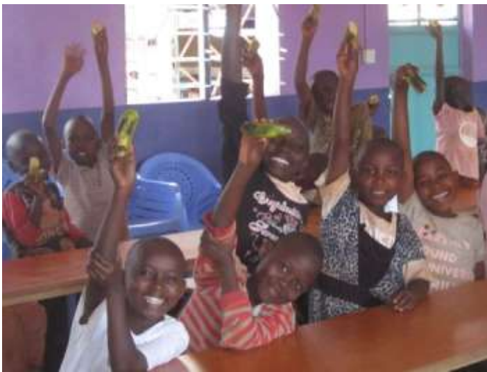
【宿題の前におやつバナナ！】

マキマのエイズ孤児施設 ACEF ジャンプアンドスマイルセンター: 日本名 希望の家では、以前に建てた食堂兼勉強部屋は、半分を寄贈頂いた本を管理する図書スペースとして使用しているため、全員で食事をしたり、勉強することが難しかったのですが、ディライツ様のご支援により、新しく食堂を増設しました。これで一緒に食事ができ、放課後は宿題や勉強をすることができるようになりました。