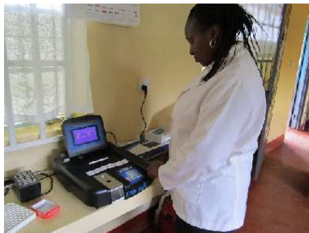
【免疫を測定するCD4測定器】