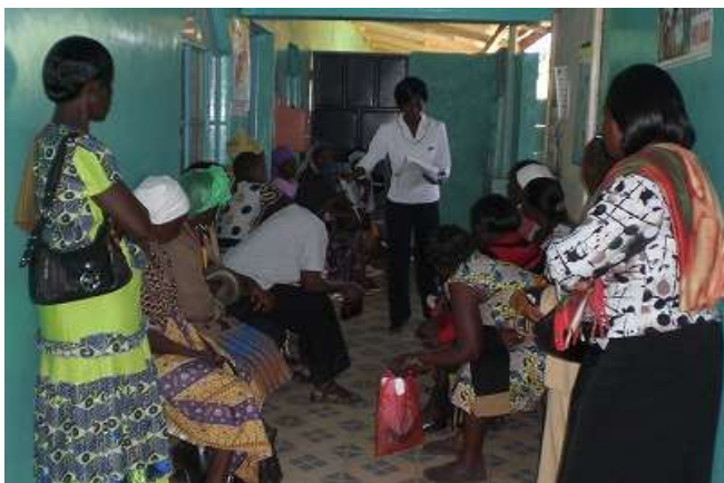
【検査結果を待つ患者さん達】