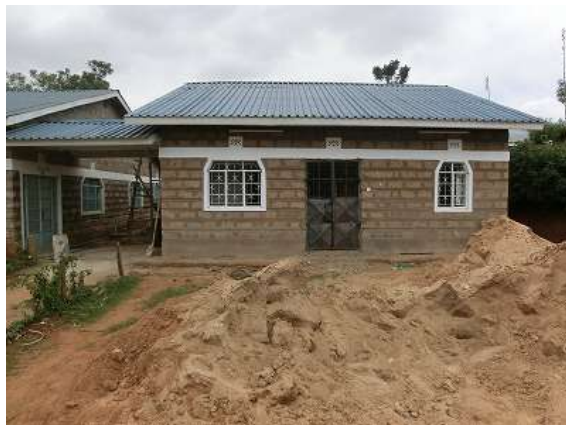
【建築途中の手術室】