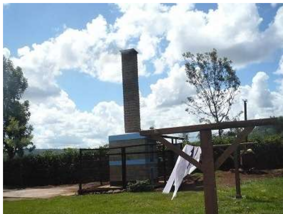
【医療器具専用の焼却炉】

また、エイズセンターには、国際ボランティア貯金、日本国際協力システム、皆さまのご支援で、各種血液検査を行う検査機器、免疫力が速やかに測定できる高度な検査機器(CD4測定器)などを導入し、より迅速・正確で、効果的な医療設備が整いました。これまでは、遠くの検査機関まで検査を依頼していたのが、近くで迅速に結果が出ると、地域の診療所からも検査依頼が次々と入り、地域住民に貢献しています。その結果、ケニア保健省からその実績を評価され、2011年から医療保険適用病院の認定を受けることになりました。